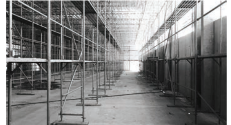
Mehrzweckhalle/Dreifachturnhalle. Blick nach Weste, mit dem Flächegerüst für die Montage der Gebäudecke.

die Zufahrt auch abgesperrt sein, da die Zahl der Parkplätze weiter reduziert wird. Der Durchgang zwischen der Reformierten Kirche und dem alten Feuerwehrmagazin wird gesperrt sein und innerhalb des Bauzaunes liegen.