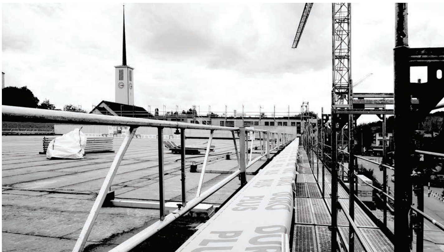
Stand der Arbeiten im Bereich der Dachfläche der neuen Mehrzweckhalle.

Seit über einem Jahr wird am imposanten Bauwerk von Derendingen Mitte gearbeitet. In unmittelbarer Nachbarschaft, nur durch einen Bauzaun abgetrennt, befindet sich das Schulhaus Mitteldorf, inklusive dem dazugehörigen Pausenareal, wo rund 170 Kinder unterrichtet werden..