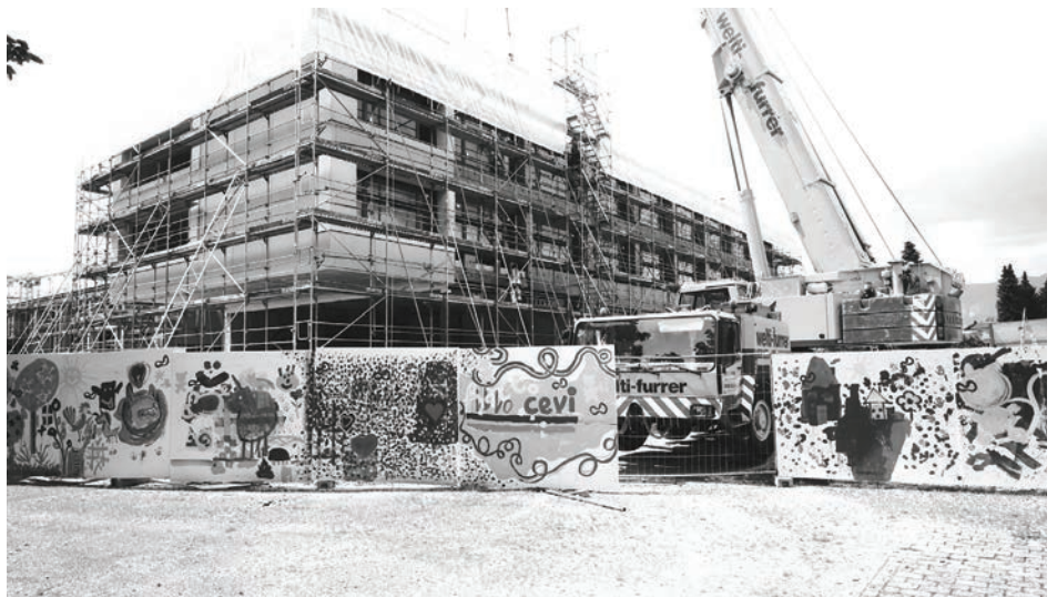
Schultrakt Ost-/Südfassade. Montage der ersten vorfabrizierten und profilierten Fassadenelemente aus Beton.

Text: Roger Spichiger