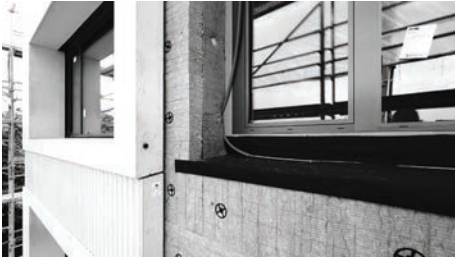
Schultrakt Ostfassade, Höhe 2. Obergeschoss. Fassadenaufbau.