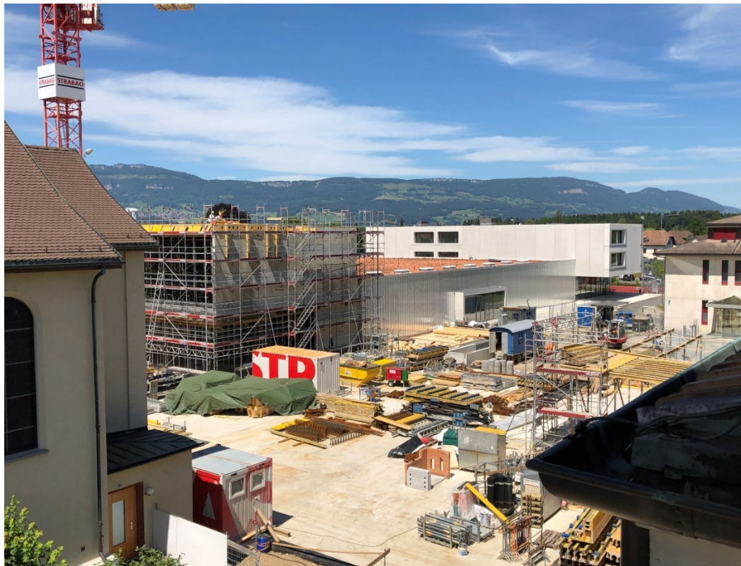
Baustelle Derendingen Mitte (Bilder vom 12. Juni 2020)